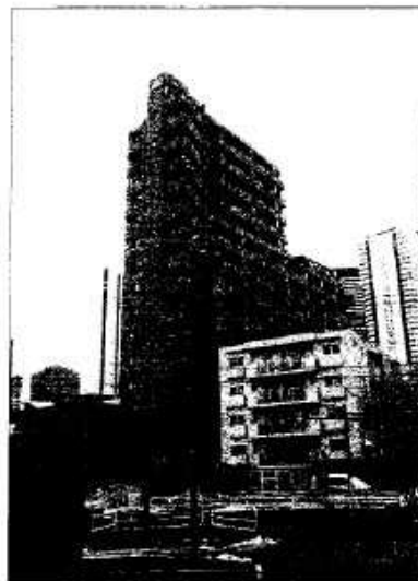
(写真は本文とは関係ありません)

サルタントと一線を画しており共感を得たようでもあります。現在、管理組合と打合せ業者側の補修工事をチェックしながら業務を進めています。